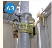
コーナーパネルを使用して干渉部に取付けた例