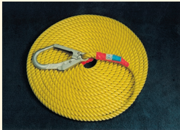
■親綱20m 大口径フック付き